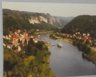
Eibtal mit Stadt Wehlen und der Bastei

Gemeinde: Ev.-Luth. Philippuskirchengemeinde Lohmen Lage: Stadt Wehlen, am Nationalpark Sächsisch-Böhmische Schweiz Bundesland: Sachsen Radweg: Elbe-Radweg Cuxhaven-Prag Eröffnung: 2004 geöffnet: täglich 11 bis 17 bzw. 18 Uhr (Ostern bis Ende Oktober), durch Touristenbegleiter Betreuung: Trinkbrunnen, WC, Fahrradabstellplätze, Schlauchautomat, Reparaturwerkzeug Besonderheiten: Gebelstein, offener Kirchgarten zum Verweilen, Ausstellungen, Veranstaltungen, Sommermusiken